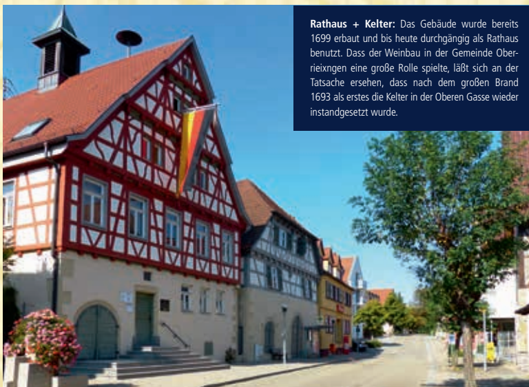
Rathaus + Kelter: Das Gebäude wurde bereits 1699 erbaut und bis heute durchgängig als Rathaus benutzt. Dass der Weinbau in der Gemeinde Oberriexingen eine große Rolle spielte, läßt sich an der Tatsache ersehen, dass nach dem großen Brand 1693 als erstes die Kelter in der Oberen Gasse wieder instandgesetzt wurde.