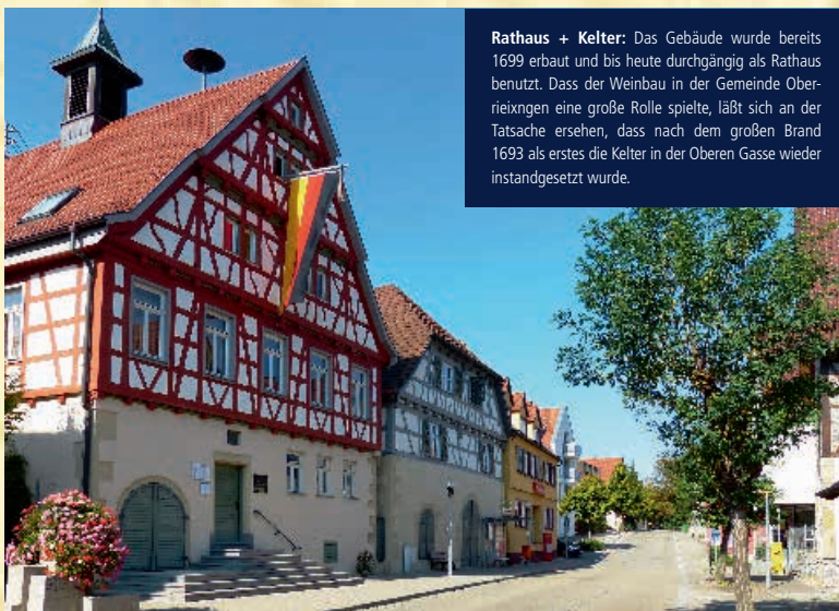
Rathaus + Kelter: Das Gebäude wurde bereits 1699 erbaut und bis heute durchgängig als Rathaus benutzt. Dass der Weinbau in der Gemeinde Oberriexingen eine große Rolle spielte, läßt sich an der Tatsache ersehen, dass nach dem großen Brand 1693 als erstes die Kelter in der Oberen Gasse wieder instandgesetzt wurde.